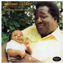
スウェディッシュ・ララバイ リチャード・“グルーヴ”・ホルムズ (P-VINE : PCD-24800)

リチャード・“グルーヴ”・ホルムズ (org)、ウィリー・エイキンス (ts)、ウィリー・ペティス・ジュニア (g)、他