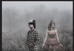
Chimera Music LLC

[THE GOASTT] ショーン・レンとシャーロット・ミュールのデュエット・バンド。 （=The Ghost Of A Saber Toothed Tiger）