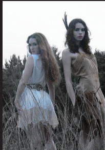
Chimera Music LLC

[Sean Lennon] 1998年にビースティ・ボーイズのレーベル＝Grand Royalから『Into The Sun』でデビュー！