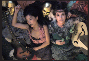
Chimera Music LLC