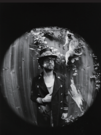
Chimera Music LLC

ショーンの発案で長年のコラボレーターである本田ゆか（元千ボ・マツ）と2008年9月に立ち上げたレーベル！ ショーンのパートナー＝シャーロット・ミュール（モデルでもある）も主要メンバーに迎え、三人の信じる高い価値観をあらゆるメディアで発信し続けることを目標とする。