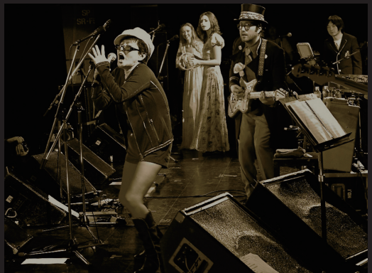
このライブのためにNYから駆けつけたオノ・ヨーコ〜夢の親子共演が実現！

やっぱりチャールス・ミンガスかな。ミンガスのレコードで一番好きなのは『黒い聖者と罪ある女』で、とても強い影響を受けたよ。その他にも、エリック・ドルフィーやマイルス・デイビスも好きだし、マイルスのレコードで好きなのは『オン・ザ・コーナー』『ビッグ・ファン』。特に『ピッチェッズ・プリュー』から『アガルタ』までの作品は最高だね。ハービー・ハンコックやヘッドハンターズなどのファンク系の音楽も好きだし、フュージョン・ジャズでいえばマヴィウス・オーケストラの『内に秘めた炎』というアルバムが好きだし、あと、バット・マルティネーノの『バイバイナ』っていうレコードも好きだよ。それにディジー・ガレスピーとか初期のビ・バップ、ジャング・ラインハルトにルイ・アームストロングとかも大好きだよ。とにかくジャズは本当に大好きなんだ。多分、ミュージシャンになるのにジャズが嫌いというのは成り立たないと思うけど (笑)。